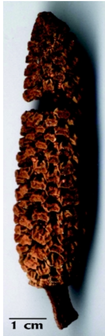
Figura 5. Detalle de un estróbilo masculino de Zamia oligodonta , después de la dehiscencia (del holotipo).

Varios individuos estériles de Z. oligodonta sp. nov. fueron observados en la localidad tipo, pero hasta la fecha sólo se han observado dos plantas en estado reproductivo (cultivadas), y las cuales portaban un solo estróbilo masculino y un solo estróbilo femenino, respectivamente. La especie aquí descrita se diferencia claramente de otras especies del género por las características vegetativas, y especialmente por la presencia, en la región distal de cada folíolo, de unos pocos dientes grandes y un ápice acuminado y ligeramente curvado hacia el extremo distal de la hoja, todo esto aunado a una textura plicada de los folíolos (ver, comparación con otras especies).