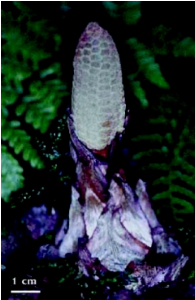
Figura 4. Estróbilo masculino inmaduro de Zamia oligodonta . Nótese los catáfilos vegetativos anchos (hacia la parte inferior de la fotografía) así como los catáfilos alargados tapando el pedúnculo (hacia la base del estróbilo).