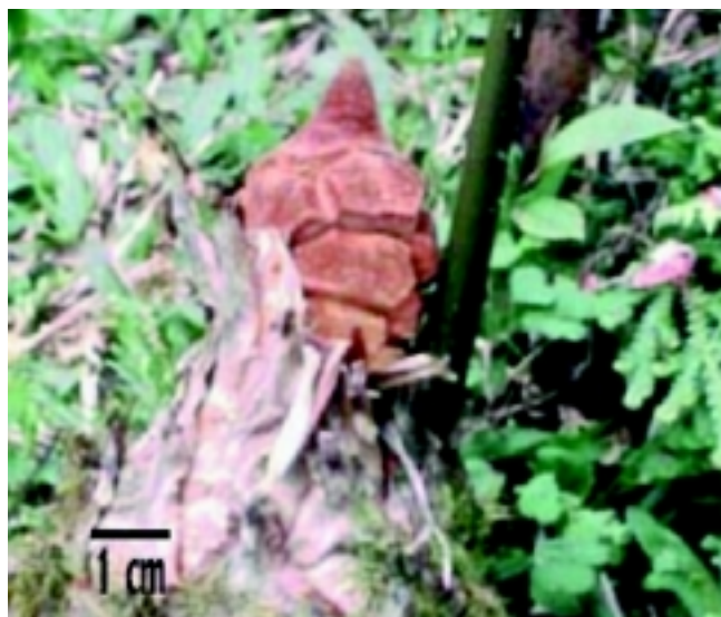
Figura 6. Estróbilo femenino inmaduro de Zamia oligodonta (algunos catáfilos han sido doblados hacia abajo)

oligodonta se parecen en varios rasgos (por ejemplo en la forma de los catáfilos y los esporófilos; o por la preferencia de hábitats premontanos), Z. montana es arborescente y sus folíolos no son acuminados (aunque también son plicados) ni tienen los gruesos dientes subapicales de Z. oligodonta .