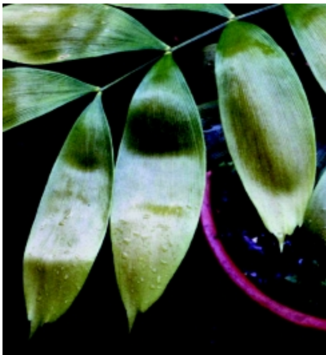
Figura 2. Hoja tierna de Zamia oligodonta , mostrando la típica coloración vernal dorada, así como los pocos dientes grandes que hay hacia el ápice de los folíolos.