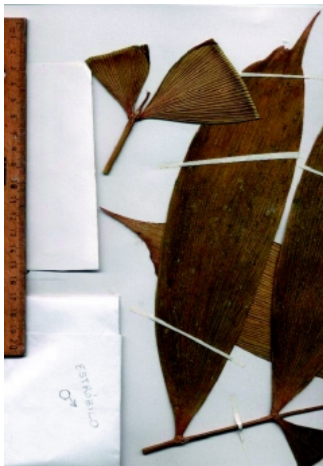
Figura 3. Parte del holotipo de Zamia oligodonta , mostrando un folíolo, algunos ápices y la región del ápice foliar, incluyendo el látigo del raquis (ver arriba-izquierda). La escala del lado muestra centímetros.

más convexo que el margen distal), pero relativamente planos (generalmente no se escinden al ser prensados), con márgenes revolutos y superficie claramente plicada, y provistos de unos pocos (uno a tres) dientes gruesos irregulares (de hasta 5 mm de longitud) cercanos al ápice, generalmente sobre el margen proximal, y además con una cauda (o porción apical) bien diferenciada y ligeramente curvada en la dirección del raquis. Las costillas o nervaduras están separadas por surcos de 2 a 3 mm de ancho. Estróbilo polínifero solitario (en la única planta masculina fértil conocida), amarillo-verdoso-grisáceo cuando joven (Figura 4), cilíndrico a ligeramente cónico, de ápice obtuso, con una longitud total de 7,2 cm y con una anchura máxima de 2 cm (en el tercio basal de la región fértil del estróbilo), con seis hileras de microsporófilos visibles lateralmente y con una región apical compuesta por cuatro a cinco hileras horizontales de microsporófilos estériles. El único estróbilo masculino conocido incluye un pedúnculo de 1,1 cm (Figura 5), parcialmente cubierto por cerca de cuatro catáfílos alargados; estos catáfílos estrobilares son escasamente tomentosos y de un color marrón oscuro rojizo (en contraste con los catáfílos vegetativos, que son de un color más plateado). Estróbilo femenino sésil, 5 x 7 cm, con dos hileras verticales de macrosporófilos fértiles lateralmente